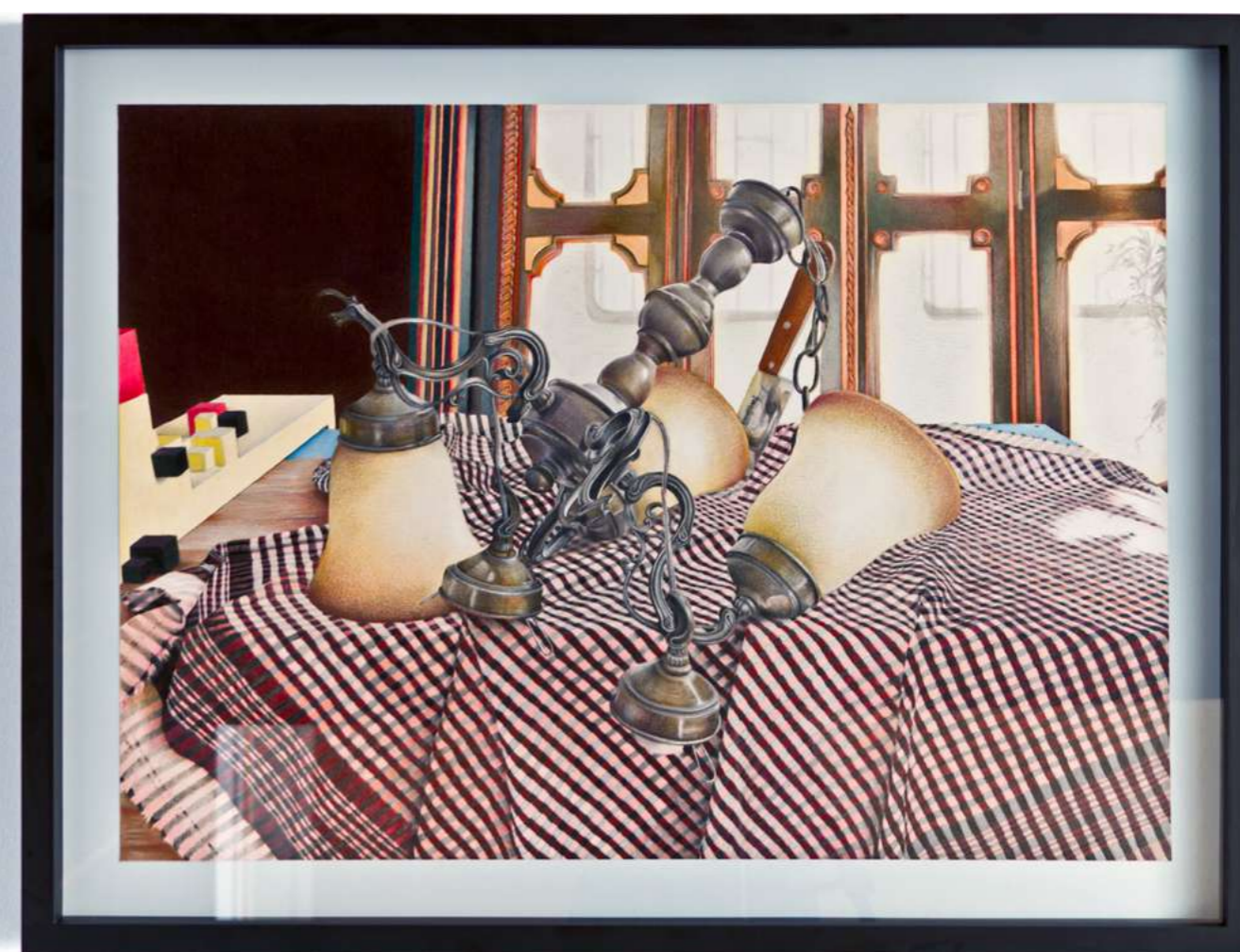
lumerencia pieza ii , 2015 dibujo lápiz de color sobre papel 77,7 x 60,6 cm