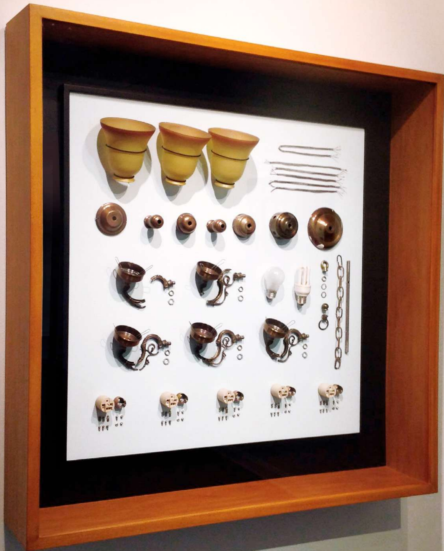
lumerencia pieza iii , 2015 lámpara desmembrada conservada en gabinete 17 x 117 x 19,2 cm