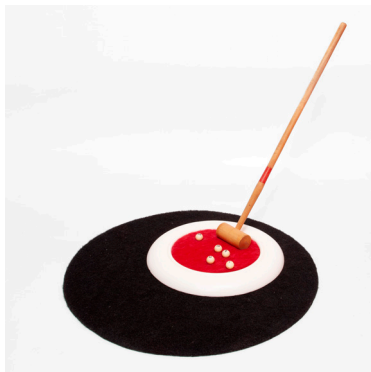
Sometimes you just got a play, 2019 Alfombra, tela, madera, y objetos ensamblados 62 x 62 x 57 cm