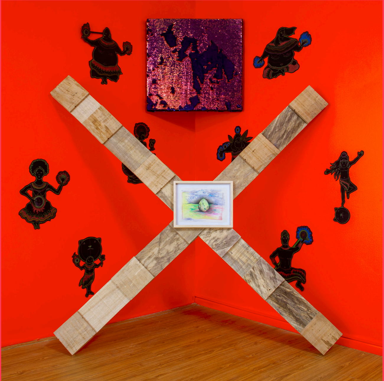
Suprematías, 2021 Instalación Madera, tela y dibujos Dimensiones variables 200 x 180 x 80 cm (aprox)