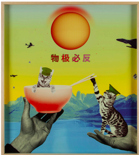
TITAN, 2020 Fotocollage digital 70 x 70 cm Ed 3