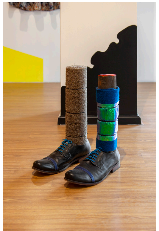
Sin título, 2021 Zapatos, madera, alfombras y plástico 30 x 30 x 41 cm