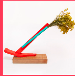
Sin título, 2021 Mueble metalico, alfombras y objetos instalados Dimensiones variables