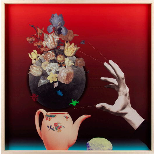
PROMETEO, 2020 Fotocollage digital 70 x 70 cm Ed 3