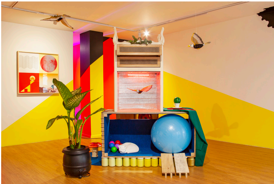
Reminiscencias, 2021 Madera, alfombra, plantas, pintura sintética, tapiz, dibujo y objetos instalados Dimensiones variables