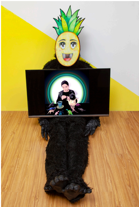
Y dormiremos más despacio, 2020/2021 Video Instalación Maniquí, impresión digital, traje de gorila y video 6' 48'' Ed 3