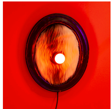
GONTA, 2019 Madera, pelaje animal artificial y bombilla 42 x 51 x 13 cm