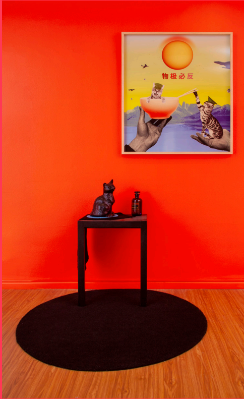
TITÁN, 2020 Instalación / Fotocollage Digital 170 x 126 x 98 cm / 80x70 cm