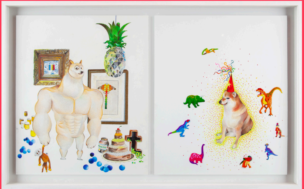
Sin título, 2020 Lapiz de color y stickers 42 x 66 cm