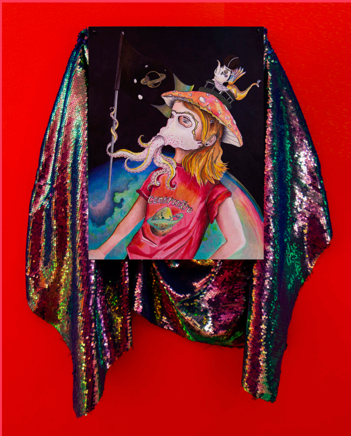
Fabulaciones para una revolución molecular en el MICELIOCENO, 2020 Tela y lápiz de color y acuarela sobre papel 40 x 30 x 8 cm