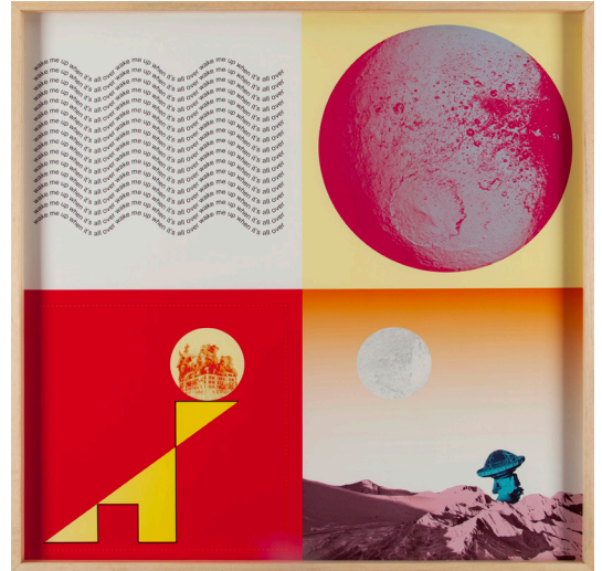
JÁPETO, 2020 Fotocollage digital 80 x 80 cm Ed 3