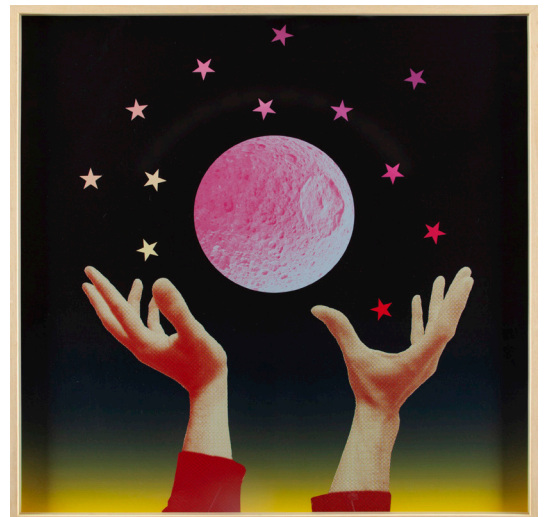
MIMAS, 2020 Fotocollage digital 80 x 80 cm Ed 3